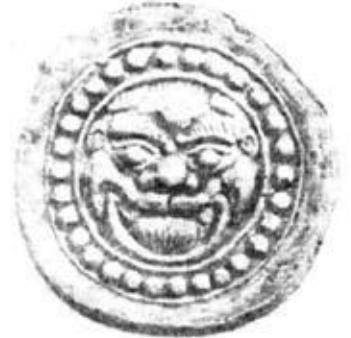
Глиняное чудовище. Найдено близ г.Уссурийска в 1957г.