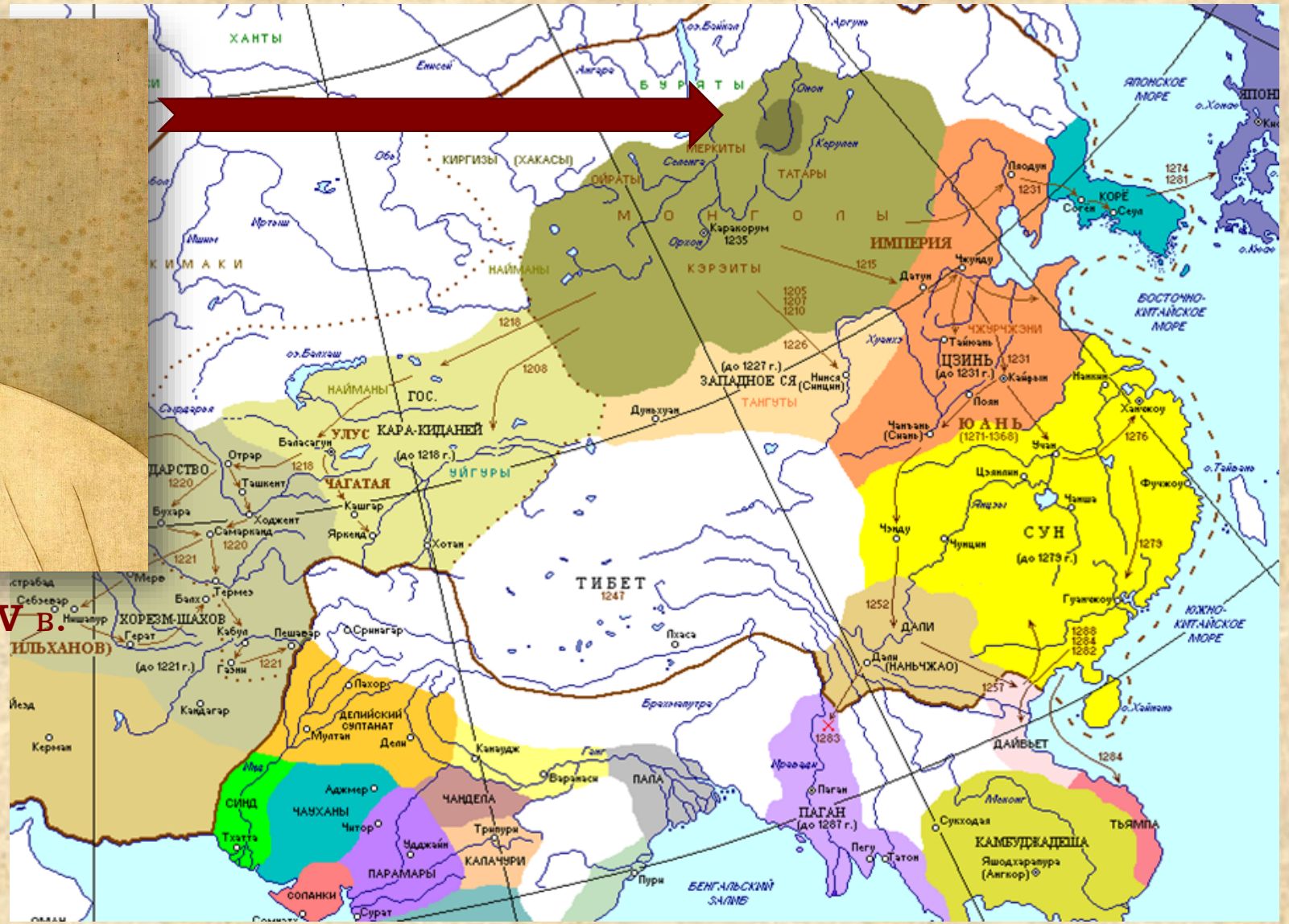
Портрет Чингисхана. Китай. XIV в.