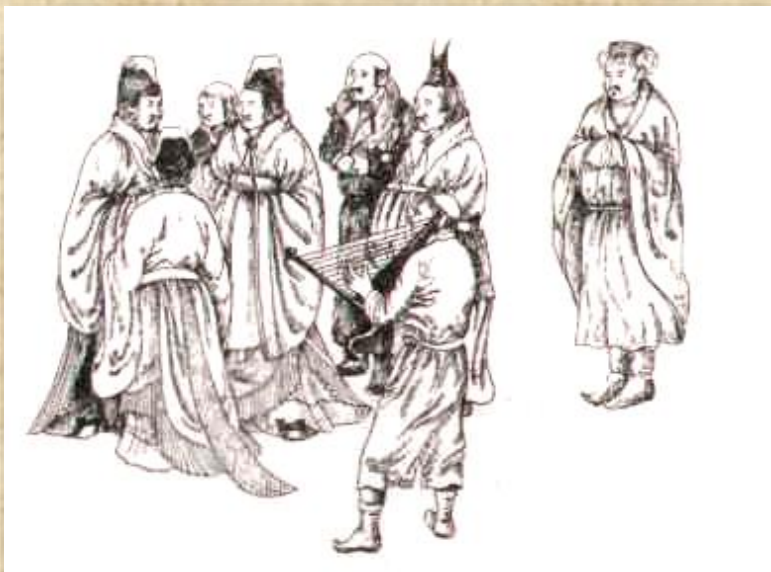
Чужеземцы при дворе Танского императора. По мотивам фрески 711 года.