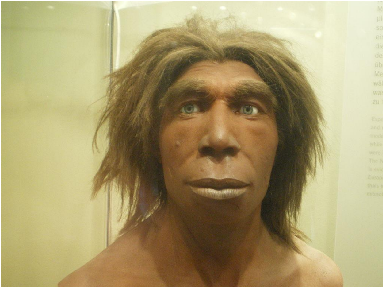
Рис.1 – неандерталец

В любом случае эти два вида имели достаточно отличий от их общего предшественника, то бишь от современного человека. По утверждению антропологов оба этих вида были гораздо ниже и шире в плечах сегодняшней модели человека, имели ряд отличий в строении черепной коробки. Лицо, а вместе с ним и губы, полости носа, разрез глаз, лобные доли были более расширены, нежели, чем у нынешних людей.