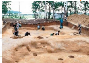
Реконструкция жилища. Урильская культура